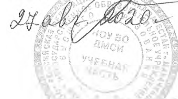
График экзаменов и зачетов с оценкой на IV курсе (7 семестр) 2020-2021 у.г.