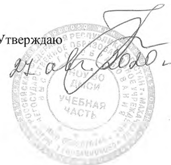
График экзаменов и зачетов с оценкой на V курсе (7 семестр) 2020-2021 у.г.